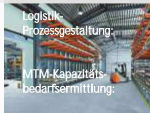
Logistik- Prozessgestaltung: MTM-Kapazitäts- bedarfsermittlung:

Die logistischen Prozesse eines Unternehmens bergen enormes Potenzial. Wir helfen Ihnen, dieses Potenzial zu erkennen und zu erschließen. Wir entwickeln Ihnen ein maßgeschneidertes Logistikkonzept und setzen dieses gemeinsam mit Ihnen um.